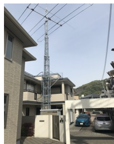
タワーを縮めて 撮影 高さ25mまで上げて運用、360度 回転可能