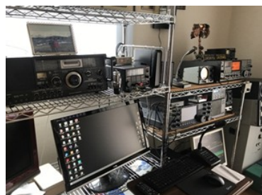
世界中と交信する無線設備