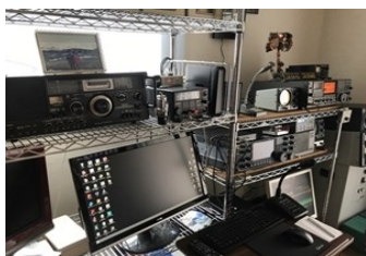
世界中と交信する無線設備