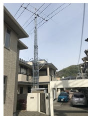
タワーを縮めて 撮影 高さ25mまで上げて運用、360度 回転可能。地球上の全域をカバーして発信します。

卒業した趣味・・・・・・・・・・ 魚釣り(海釣り) 記念切手の収集 記念コインの収集