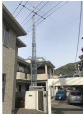
タワーを縮めて 撮影

高さ25mまで上げて運用、360度 回転可能。地球上の全域をカバーして発信します。