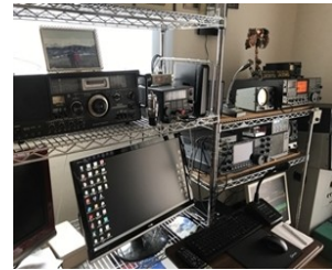
世界中と発信する無線設備

高さ25mまで上げて運用、360度 回転可能。地球上の全域をカバーして発信します。