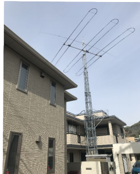
アンテナはアメリカ製で高さ25mまで上げて運用、360度 回転可能。地球上の全域をカバーして交信します。